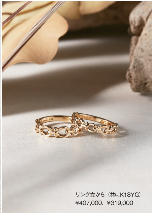
リング左から (共にK18YG) ¥407,000、¥319,000