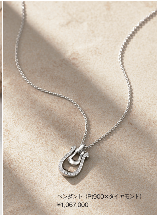
ペンダント (Pt900×ダイヤモンド) ¥1,067,000