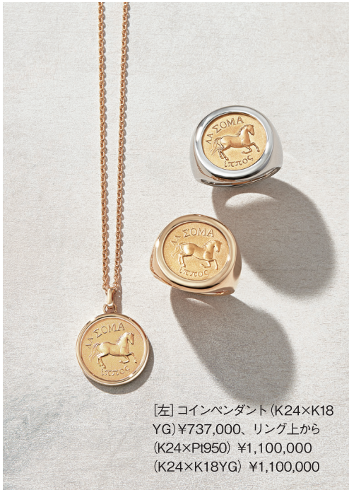
[左] コインペンダント (K24×K18 YG) ¥737,000、リング上から (K24×Pt950) ¥1,100,000 (K24×K18YG) ¥1,100,000